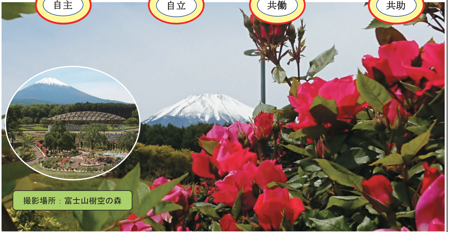
撮影場所：富士山樹空の森