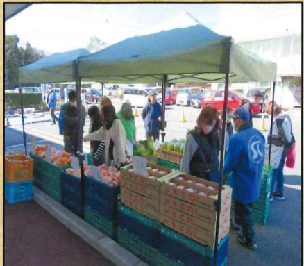
野菜・焼いも販売